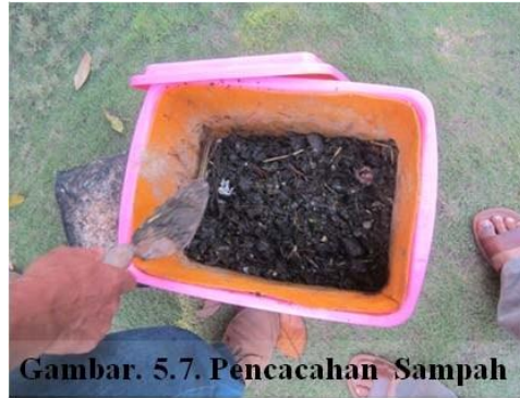
Gambar. 5.7. Pencacahan Sampah

Kompos yang baik adalah kompos yang terurai dengan sempurna, tidak berbau, dan berwarna coklat kahitaman seperti tanah juga berefek baik jika diaplikasikan pada tanah (Desakuhijau, Kompas 11 Februari 2011, Kompos Keranjang Takakura).