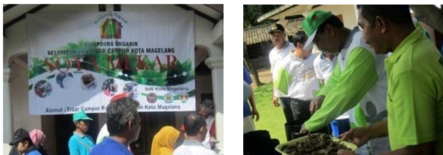
Gambar 6. Peresmian Kampung Organik Soya Mekar oleh Walikota Magelang

Kampung organik Soya Mekar di Tidar Campur pada tanggal 1 Juni 2014 diresmikan oleh Walikota Magelang sebagai kampung organik ketujuh yang telah dibentuk di Kota Magelang. Peresmian dilaksanakan pada saat Walikota Magelang melaksanakan kegiatan blusukan dari kampung ke kampung , dan ditandai dengan penanaman bibit bunga sedap malam oleh Walikota dan istri serta wakil wali kota.