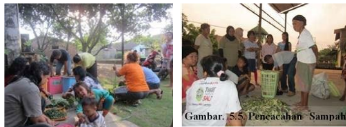
Gambar. 5.5. Pencacahan Sampah

Kegiatan pelatihan tersebut selanjutnya diinformasikan ke setiap RT, dan diharapkan masing-masing RT juga melakukan aktivitas pengolahan sampah organik dengan menggunakan keranjang takakura. Dengan demikian Kampung Organik di kedua tempat tersebut akan segera terealisasi.