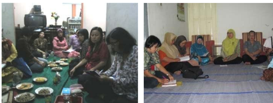
Gambar 1. Sosialisasi Kampung Organik di Tidar Campur dan Sampang

Mereka tampak antusias dengan program ini karena program tersebut juga merupakan program unggulan Kota Magelang melalui Pembentukan Kampung Organik di setiap RW, dan bagi RW yang menyelenggarakan program ini akan diberi bantuan dari Pemerintah Kota Magelang sebesar 47 juta rupiah.