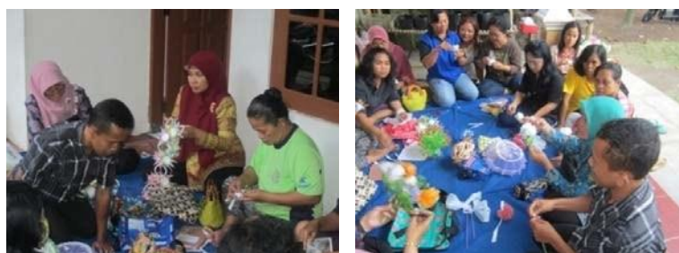
Gambar 7. Pelatihan Pengolahan Sampah Anorganik Menjadi Aneka Souvenir

Pelatihan dilaksanakan pada tanggal 5 dan 11 Juni di Tidar Campur dan tanggal 6 dan 13 Juli 2014 di Sampangan. Hasil pelatihan diharapkan dapat menghasilkan produk-produk yang dapat dimanfaatkan untuk keperluan sehari-hari seperti taplak dan tudung saji serta dapat dijual sebagai souvenir.