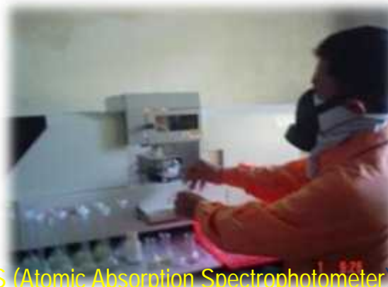
AAS (Atomic Absorption Spectrophotometer)